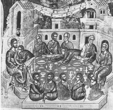
1. Ιερά Μονή Βαρλαάμ. Παρεκκλήσι Τριών Ιεραρχών. Ο Μυστικός Δείπνος (ζωγράφος Ιωάννης Ιερεύς εκ Σταγών, 1637).