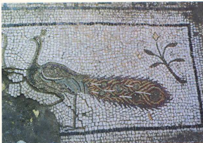
2. Λάρισα. Βασιλική οδού Κύπρου. Νάρθηκας. Λεπτομέρεια ψηφιδωτού δαπέδου.