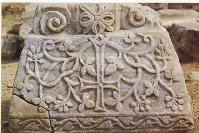
7. Φθιώτιδες Θήβες (Νέα Αγχιάλος). Συγκρότημα βασιλικών του αρχιερέως Πέτρου. Επίθετο με συμφρές κιονόκρανο.

Ανασκάφτηκε το 1976 σε οικόπεδο της οδού Παπακυριαή 3, ιδιοκτησίας Γ. Κατσίγρα. Έχει