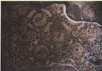
1. Λάρια. Βασιλική Φουρίου. Νάρθηκας. Λεπτομέρεια ψηφιδωτού δαπέδου.

Βασιλική Φίλιας στη θέση «Χαμάμια», όπου ιερό Αθηνάς παρά τον Κουράλιον (ή Κουάριον) ποταμό της Θεσσαλιώτιδας. Ανασκάφηκε κατά το 1964 12 . Πρόκειται για τρικλιτη βασιλική