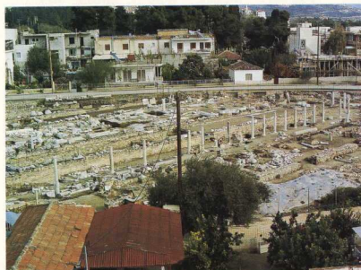
6. Φθιώτιδες Θήβες (Νέα Αγχιάλος). Συγκρότημα βασιλικών του αρχιερέως Πέτρου. Γενική άποψη, από νοτιοδυτικά.

ελληνιστικού τύπου, με νάρθηκα και ημικυκλική αψίδα. Στο ιερό ίχνη ψηφιδωτού δαπέδου. Το δάπεδο του κεντρικού κλίτους από πλήνινες πλάκες. Στην τοιχοδομία χρησιμοποιήθηκε αρχαίο υλικό από το ιερό της Αθηνάς. Χρονολογία: 5ος αι. μ.Χ.