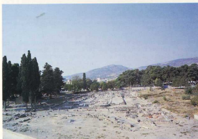
4. Φθιώτιδες Θήβες (Νέα Αγχιάλος). Βασιλική Αγίου Δημητρίου. Γενική άποψη. Από ανατολικά.