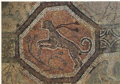
9. Φθιτιδες Θήβες (Νέα Αγχάλιος). Συγκρότημα βασιλικών του αρχιερέως Πέτρου. Λεπτομέρεια ψηφιδωτού δαπέδου του νοτίου κλίτους της βασιλικής του 8ου αι. μ.Χ.

φτηκε περιοδικά από το 1929-1954 από τον Γ. Σωτηρίου. Επαναλήφθηκε η ανασκαφή το 1969 και συνεχίζεται μέχρι σήμερα από τον Π. Λαζαρίδη. Πρόκειται για τρεις επάλληλες βασιλικές. Η πρώτη χρονολογείται στα μέσα ή στο δεύτερο μισό του 4ου αι. μ.Χ., η δεύτερη στα μέσα ή στο δεύτερο μισό του 5ου αι. μ.Χ. και η τρίτη στην εποχή του Ιουστινιανού του Α' (532 μ.Χ.). Οι τρεις επάλληλες βασιλικές μαζί με τα προσκίματα καταλαμβάνουν χώρο 7.000 τ.μ. και έχουν κτιστεί πάνω σε μυκηναϊκά και υστερορωμαϊκά ερείπια. Πλουσιότερα ήταν ο διάκοσμος του μνημείου σε μαρμάρια αρχιτεκτονικά και διακοσμητικά μέλη (εικ.7), εντοίχια ψηφιδωτά και τοιχογραφίες. Ιδιαίτερα ενδιαφέρον παρουσιάζουν τα δάπεδα της πρώτης και της τρίτης βασιλικής, τα οποία κοσμούνται με ψηφιδωτά (εικ. 8, 9) και χαρακτηρίζονται για την υψηλή τους ποιότητα και την ποικιλία του θεματολογίου. Από το όνομα του Αρχιερέως Πέτρου, που αναγράφει σε ανακαινιστική επιγραφή του νοτίου κλίτους της τελευταίας βασιλικής, χαρακτηρίστηκε όλο το συγκρότημα «βασιλική του Αρχιερέως Πέτρου».