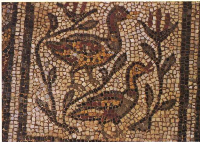
10. Παλάτι Βόλου. Λεπτομέρεια ψηφιδωτού δαπέδου της παλατιοχριστιανικής βασιλικής.

von βασιλική στη Β.Α. καμπή του τείχους, με ψηφιδωτά δάπεδα.