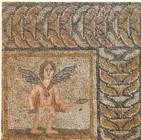
3. Λάρια. Λεπτομέρεια ψηφιδωτού δαπέδου αστικού κτίσματος οδού Παπακυριαζή.