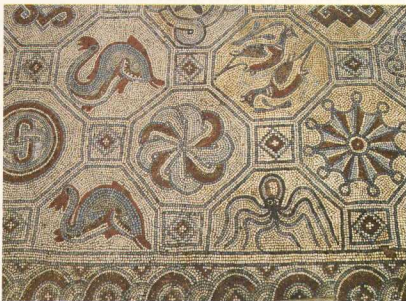
5. Φθιώτιδες Θήβες (Νέα Αγχιάλος). Βασιλική Μαρτυρίου. Λεπτομέρεια ψηφιδωτού δαπέδου από το νάρθηκα.