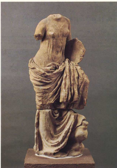
*Άγαλμα Μούσας, πιθανώς της Τερψιχόρης. Η ταύτιση βασίζεται στον αγαλματικό τύπο και στο γεγονός ότι η μορφή κρατάει στο αριστερό χέρι μια λύρα που το ηχείο της έχει τη μορφή οστράκου χελώνας. Το πόδι της πατάει σε βράχο που δηλώνει ταπία, πιθανώς τους πρόποδες του Ολύμπου.

Οι ανασκαφές των τελευταίων χρόνων απέδειξαν, πέρα από κάθε αμφιβολία, ότι όλα τα ιερά του Διού, δύο θέατρα και το στάδιο βρίσκονται έξω από τα τείχη, σε μια έκταση που έχει τουλάχιστον το ίδιο μέγεθος με την αρχαία πόλη. Δεν αποκλείεται, εκεί που σήμερα αναβλύζει μια μεγάλη πηγή και σχηματίζει τη λιμνούλα που οι εντόπιοι ονομάζουν «Βούλη», να ήταν το ιερό των Μουσών. Το τέμενος του Διός, σύμφωνα με όλες τις ενδείξεις, βρίσκεται πιο νότια, κοντά στο ρωμαϊκό θέατρο. Εκεί αποκαλύφθηκαν κτήρια που σχετίζονται με τη λατρεία, πολλά θραύσματα γλυπτών, ένας τοίχος που ξεπερνά τα 100 μέτρα, και είναι ίσως ο περιβόλος του ιερού, ένα μικρό ανάγλυφο που εικονίζει τον Δία, προ παντός όμως δύο επιγραφές, στις οποίες όχι μόνο γίνεται αναφορά στο τέμενος του Διός του Ολυμπίου αλλά ορίζεται ρητά ότι εκεί πρέπει να στηθούν. Η μια επιγραφή είναι ψήφισμα τιμητικό, γύρω στο 300 π.Χ., όπου αναφέρεται ναός και τέμενος του Διός του Ολυμπίου· η άλλη είναι βασιλική επιστολή του Φιλίππου V προς τους Δημητρίους (ι) και τους Φεραίους και χρονολογείται το 206 π.Χ. Είναι ιδιαίτερα σημαντικό για το ρόλο του ιερού στην πολιτεία των Μακεδόνων ότι το δεύτερο αυτό κείμενο δεν έχει καμιά σχέση με