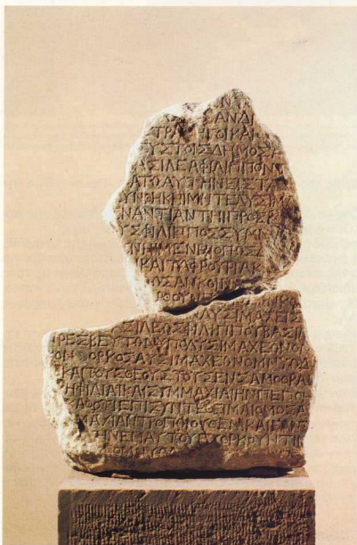
Κείμενο συνθήκης συμμαχίας ἀνάμεσα στο Φίλιππο καὶ τοὺς Λυσιμαχεῖς.