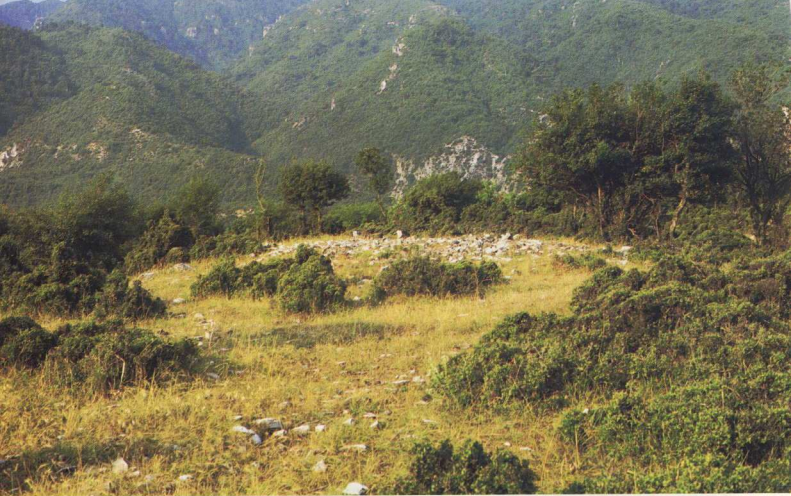
Λιθωσφός που σχηματίζει τύμβο. Στο κέντρο μια όρθια μεγάλη πέτρα ήταν το σήμα. Πρώιμη εποχή σιδήρου. Μεσσηνία (δυτικά, έξω από το σημερινό χωριό Δίων).