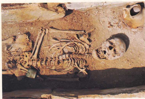
Γυναίκα ταφή από τον τύμβο 7 του νεκροταφείου της πρώιμης εποχής του σιδήρου στο Μεσσήνη, δυτικά από το σημερινό χωριό του Δίου.

σημαίνει ότι στα πρώιμα αυτά χρόνια η περιοχή είναι πυκνά κατοικημένη. Η αναζήτηση των οικισμών είναι το άμεσως επόμενο ζητούμενο και ίσως σύντομα να υπάρξουν στοιχεία αρχαιολογικά. Σ' ένα σημαντικό οικισμό φαίνεται να ανήκουν οι λίθινες «κρηπίδες» κτισμάτων που βρίσκονται στην παρυφή του νεκροταφείου, στη θέση Άγιος Βασίλειος. Πρόκειται για ένα από τους προσεχείς ατόχους στο ανασκαφικό πρόγραμμα.