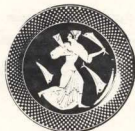
σχ. 28. Πινάκιον

Τα πινάκια έχουν το σχήμα πιάτου αλλά παρουσιάζουν πολλές ποικιλίες: με στέλεχος και δύο λαβές, τετράγωνα ή κυκλικά, αβαθή ή βαθιά. Η λέξη πινάξ σημαίνει αρχικά επίπεδο ή σανίδα και πρέπει να αναφέρεται σε ξύλινα πιάτα.