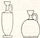
σχ. 22. Λήκυθος α, β

γ) Ο τύπος αυτός φέρει κοντόχονδρο σώμα, επίπεδη βάση και όχι ευδιάκριτο ώμο (αρυβαλλόσχημη λήκυθος) (σχ. 22γ).