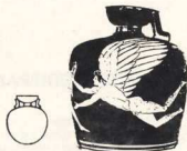
σχ. 23. Αρύβαλλος α, β

β) «Αττικός»: φέρει ημισφαιρικό στόμιο και συνήθως δύο στενές λαβές με προεξοχές (σχ. 23β).