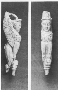
Σφίγγα (14ος-13ος αι. π.Χ.), ελεφαντόδοντο, Ακρόπολη Αθηνών.