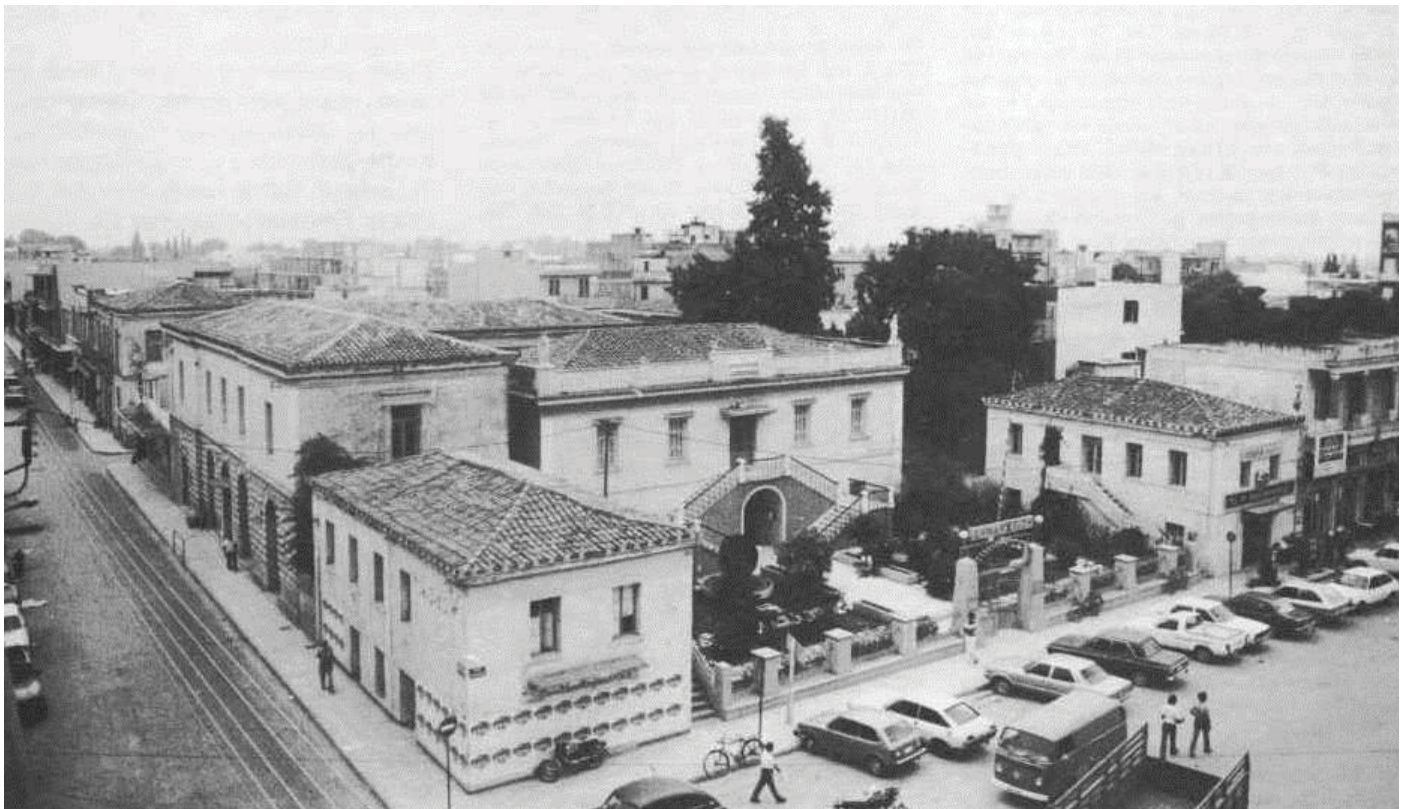
Αποψη του συγκροτήματος των κτιρίων του Δημαρχείου Άργους το 1979. Φαίνεται αριστερά το κτίριο-προσθήκη του 1889-90.