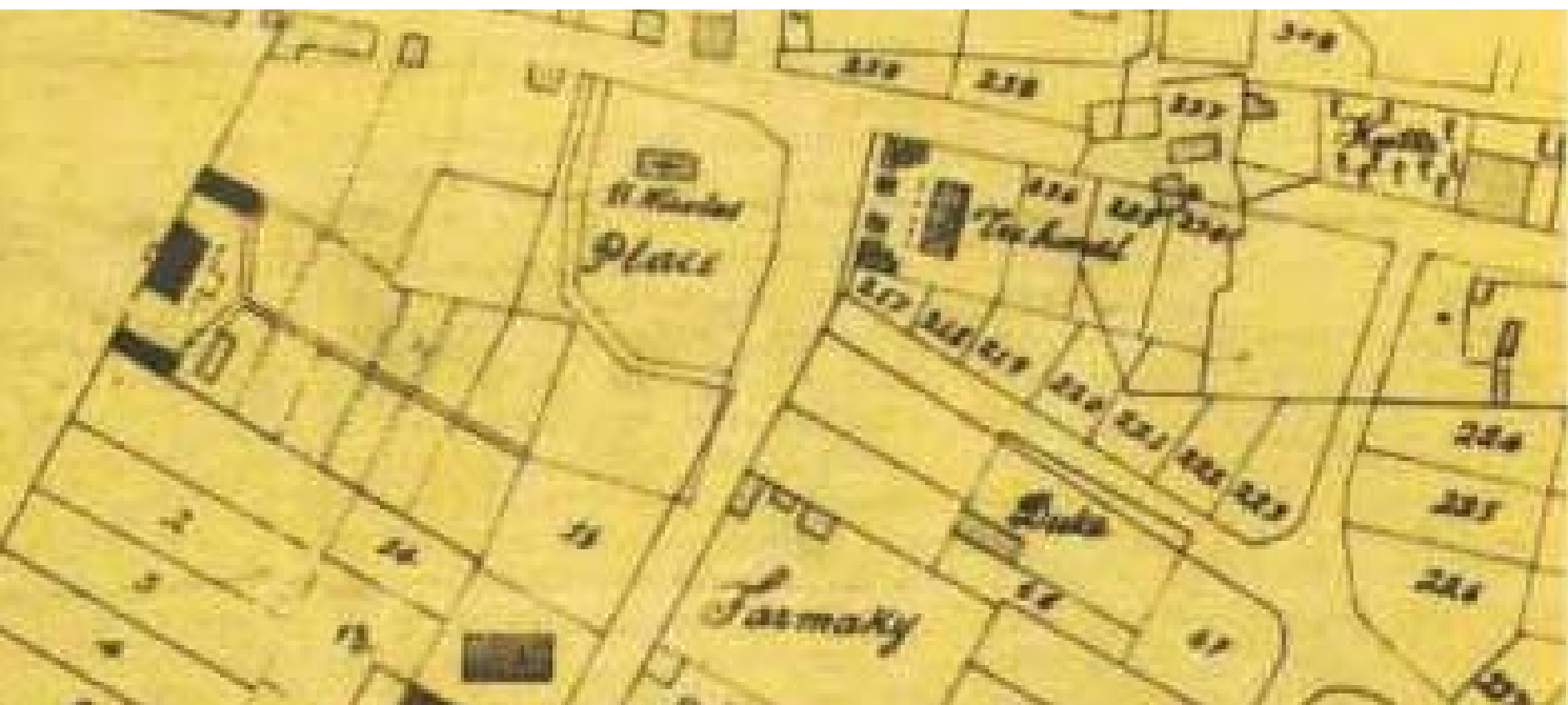
Πρόκειται για τους Στρατώνες του Ιππικού, για το Δημόσιον Κατάστημα, για το Αλληλοδιδασκτικό σχολείο και για το «Παλάτιον της Κυβερνήσεως» («Καλλέργειον»). Το πρώτο σχέδιο βρίσκεται στα αρχεία του Γαλλικού Στρατού και το δεύτερο στα αρχεία του ΥΠΕΧΩΔΕ.

Τζάνογλου». Και συνεχίζουν: «Σήμερα δε με την ευχήν της Κυβερνήσεως έλαβεν τέλος κατά το σχέδιον του μηχανικού Κυρίου Δεβώ. Ένεκα τούτου παρακαλούμεν την αυτού εξοχότητα ως είθισται εις τους πιστώς δουλεύσαντας υπαλλήλους της Κυβερνήσεως, να αναγνώριση την ειλικρινήν μας δούλευσιν και να αποζημίωση τους κόπους μας».