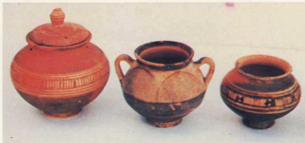
Πρωτογεωμετρικὸ ἀγγεῖο ἀπὸ τὴ Χαλκίδα

σονήσου καλύπτονταν ἀπὸ χαμηλοῦς λόφους: τοῦ Καλλιμάνη, τοῦ Ἀγ. Ἰωάννου, τῆς Βροντοῦ, τῶν Γύφτικων καὶ ὅτι οἱ πρωτογεωμετρικοὶ τάφοι, πού ἔχουν βρεθεῖ ὡς σήμερα, εἶναι ὅλοι ἀνοιγμένοι περιμετρικὰ εἰς τὰ ριζὰ τῶν λόφων αὐτῶν. Ἡ παρατήρη-