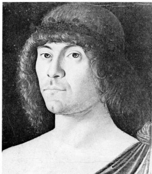
9. Τζοβάννι Μπελλίνι, (περ. 1430-1516), Δορυστεφανωμένος ποιητής, Μουσείο του Πύργου των Σφόρτσα, Μιλάνο.