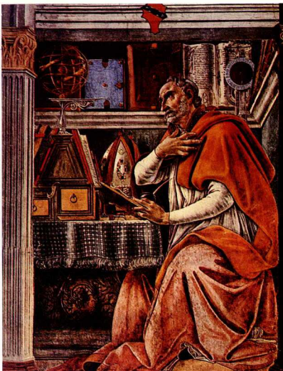
8. Σάντρο Μποττιτσέλλι, Ο Άγ. Αυγουστίνος, 1480, Φλωρεντία, Εκκλησία των Αγίων Πάντων. Οι λόγιοι πατέρες της Καθολικής Εκκλησίας απεικονίζονται ως σύγχρονοι ουσιαστές και μοιράζονται μαζί τους τα ίδια ενδιαφέροντα (το σύγγραμμα του Ευκλείδη λ.χ.) και το ίδιο πλαίσιο ζωής. Η τυπική αυτή σύνθεση αποκαλείται «Studioio» (στοχαστήριο).