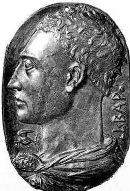
4. Αλμπερτί (1404-1472), Αυτοπροσωπογραφία, χάλκινη πλάκα, Εθν. Πινακ. Ουάσιγκτον. Συνειδητή αναφορά σε αρχαία ρωμαϊκά πρότυπα. Κάτω αριστερά διακρίνεται το προσωπικό έμβλημα (impresa) του Αλμπερτί: ένας φτερωτός οφθαλμός που απολήγει σε φλόγες. Το οικόσημο αντικαθίσταται από το προσωπικό έμβλημα, επλεγμένο σύμβολο του ατόμου, του χαρακτήρα του και των σκοπών της ζωής του.