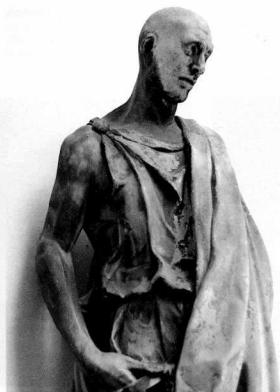
3. Ντονατέλλο, Ο προφήτης Αθακούμ 1427-1436, Χαλκός, Μουσείο της Καθεδρικής, Φλωρεντία. Ένα από τα πρώτα τολμηρά δείγματα του νέου ύψους του αστικού ρεαλισμού. Ο λαός «βαφτίσας» τον προφήτη «ο τσοούκος» (zuccone), σαν να ήταν ένας απλός συμπολίτης του.

Η λατρεία του προσώπου, της μοναδικής του ταυτότητας, θα γίνει τώρα ένα από τα σταθερά γνωρίσματα της νέας εποχής. Το καινούριο αυτό ενδιαφέρον για τον άνθρωπο εξηγήει την επιτυχία που γνωρίζουν μερικές νέες φιλολογικές και καλλιτεχνικές μορφές, όπως η βιογραφία, η αυτοβιογραφία, η προσωπογραφία, ο τόμος με το πορτρέτο του νεκρού, το προσωπικό έμβλημα (impresa). Το όνομα του μεγάλου Ιταλού ποιητή Δάντη συνδέεται με μια από τις πρω-