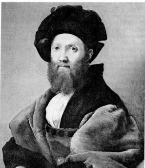
11. Ραφαήλλο, Μπαλτάσαρ Καστιλιόνε, περ. 1515, ελαίω-γρ., Λούβρο, Παρίσι. Ο Αιλικός, του Καστιλιόνε ακαγραφεί το φιλολογικό πορτρέτο του ιδανικού ανθρώπου της Αναγέννησης.