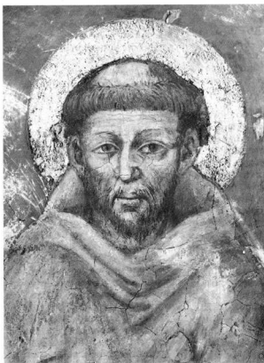
1. Τσιμαμπουέ (πέθ. το 1302). Ο Άγιος Φραγκίσκος της Ασίζης, τέλος 13ου αι., ναποερ., Άγιος Φραγκίσκος. Μια από τις πρωμότερες προσωπογραφίες της νεότερης τέχνης.

την αρχή, ή τουλάχιστον αφού διαμορφωθούν, εκείνο που μέλλουν να κρατήσουν ως την αιωνιότητα. Εσύ μονάχα μπορείς να μεγαλώσεις και να αναπτυχθείς όπως και όσο θέλεις, έχεις μέσα σου τα σπέρματα της ζωής σε όλες της μορφές της» 15 . Αναγνωρίζοντας την ποικιλία των κατευθύνσεων και τις αποχωρήσεις των διαφόρων φιλοσοφικών συστημάτων που ξαναστοιχάζονται τη φύση και τη θέση του ανθρώπου μέσα στον κόσμο τον καιρό της Αναγέννησης, μπορούμε να διακρίνουμε μερικές δεσποζουσες: την ομορφιάνια τους για την ελεύθερη βούληση και την προαίρεση , τη δυνατότητα εκλογής που διαθέτει ο άνθρωπος την κοινή παραδοχή τους ότι το πιο ανθρώπινο γνώρισμά του είναι η ελευθερία , μια ελευθερία δυναμική , που οφείλει να την κατακτήσει με το πνεύμα του και με το έργο του. Με τις ικανότητες αυτές ο άνθρωπος μπορεί να εργαστεί, όχι μόνο παρακολουθώντας τους νόμους της φύσης, αλλά, σύμφωνα με την άποψη του Τζιρόντο Μπρούνο (1548-1600), «ακόμη και να υπερβεί τους νόμους της. Έτσι, δημιουργώντας ή έχοντας τη δύναμη