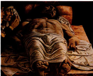
5. Α. Μανέττι, Ο Χριστός νεκρός, περ. 1480, Πινάκ. Μπρέρα, Μιλάνο. Ο θάσιος εξανθρωπισμός των ιερών θεμάτων αισθητοποιεί την ανθρωποκεντρική κοσμοθεωρία της αναγέννησης.

Πριν ακόμη η νέα κοινωνική λειτουργία της τέχνης διειρύνει τα είδη και τη θεματογραφία της, και ενώ εξακολουθεί να καλύπτει κατά κύριο λόγο ανάγκες της θρησκείας και λατρείας, ο ανανεωτικός άνεμος τη ζωονοεί και τη μεταμορφώνει. Ο εξανθρωπισμός του δόγματος, το ρίγος του ανθρώπινου πάθους που διatrέχει τις ιερές σκηνές, είναι το πρώτο σημάδι της αλλαγής. Πριν ακόμη τα παλιά σχήματα της ιδεαλιστικής τέχνης αντικατασταθούν, οι ανυπόστατες και άυλες βυζαντινές μορφές εμμυχώνονται από αισθήματα, αγάλλονται και πάσχουν, θρησκείας και λατρείας, ζουν και εκφράζονται σαν απλοί καθημερινοί άνθρωποι. Την αλλαγή τούτη την αισθάνθηκε και η θυεαντική τέχνη, ιδιαίτερα στην περίοδο των Παλαιολόγων. Παράλληλα, ο υπερβατικός και υπερχρονικός χαρακτήρας των ιερών σκηνών υποχωρεί. Οι χωροχρονικοί προδιορισμοί πληθαίνουν. Δέντρα, λουλούδια, κτίσμαι,