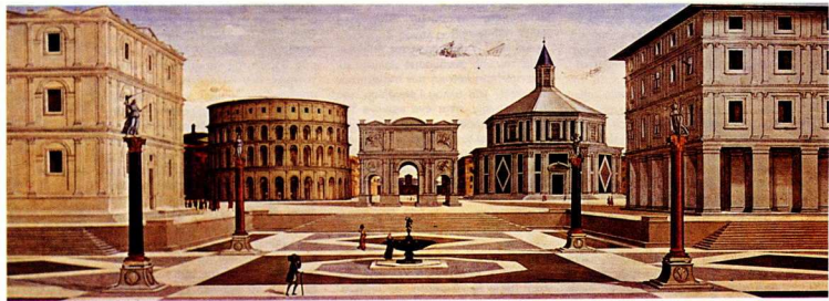
Το Λουσιάνο Λαουράνα, Προοπτική άποψη πόλεως, γύρω στο 1470. Πινاک. Γουώλτερς, Βαλτιμόρη. Η κεντρική προοπτική του Αλμπέρτι είναι, σύμφωνα με τον ιστορικό Πανόφσκυ, το αισθητό σύμβολο της ανθρωποκεντρικής κοσμοθεωρίας της Αναγέννησης.