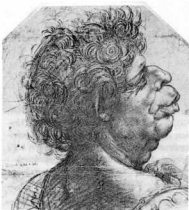
10. Λεονάρντο ντα Βίντσι, Γκροτέσκο κεφάλι, σχέδιο, Εκκλησία του Χριστού, Οξφόρδη. Η «φυσιογνωμική» ενδιέφερε ιδιαίτερα το Λεονάρντο, που θεωρούσε το πρόσωπο καθρέφτη της ψυχής. Δύο ψευδοριστοτελικά συγγράμματα καθοδηγούν τους καλλιτέχνες στις φυσιογνωμικές μελέτες τους.

Harper Torchbook, New York, 1961., σ. 124-5. Βλ. και του ίδιου Renaissance Thought, II, Ed. Harper Torchbook, New York, 1965, σ. 89-102.