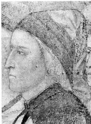
2. Απόδ. στον Τζόττο, Προσωπογραφία του Δάντη, αρχές 14ου αιώνα, λεπτ. ναποερ. από το Μπαρτζέλλο (Εθν. Μουσείο της Φλωρεντίας). Μια από τις πρωμότερες μαρτυρημένες προσωπογραφίες.