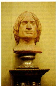
7. Αγνωστού, Προτομή του Λαυρεντίου του Μεγαλοπρεπούς (1449-92), πηλός Σιλλ. Λομβόλεον, Οξφόρδη. Ακόμη και η ασκήνια τονίζεται ως έκφραση της μοναδικής ταυτότητας του στόμου.

δέονται με την εικονογραφία της τέχνης και ο συμβολισμός τους είναι πιο ευανάγνωστος. Πολύ μεγαλύτερη σημασία έχουν, ωστόσο, οι αλλαγές που μεταμορφώνουν τη μορφολογία και τους νόμους της: η νέα αντίληψη και παράσταση του χώρου, η καινούρια νόηση και διατύπωση της φόρμας, η μελέτη του φυσικού φωτός και η λειτουργία του σκιαστικισμού, η νέα συντακτική δομή των στοιχείων της σύνθεσης.