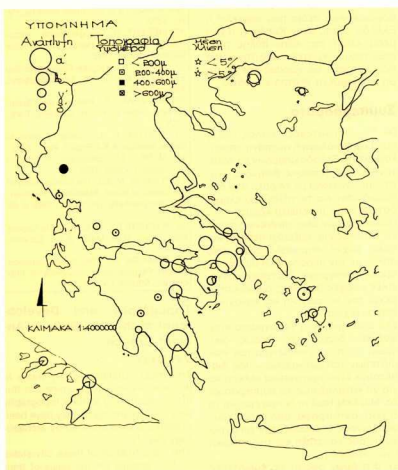
Χάρτης 3. Βαθμίδα ανάπτυξης πόλης - κράτους και τοπογραφία.

κυριάρχησαν με κύρια λειτουργία την αστική -δηλ. τη συσπείρωση πολιτών για συλλογική ευημερία- και όχι τη θρησκευτική - Δελφοί, Επίδαυρος, Αμφικράτειο - ή τη διεξαγωγή αγώνων - Ολυμπία, Ίσθια, Νεμέα-, αν και οι δύο αυτές λειτουργίες ήταν συχνά άμεσα συνδεδεμένες με την αστική.