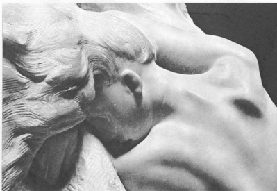
Ροντέν, Δαναΐς, μάρμαρο 1865 (Μουσ. Ροντέν, Παρίσι)

Από το βιβλίο της Μαρίας Λαμπράκη-Πλάκα: Ο Ροντέν και η αρχαία ελληνική τέχνη, Εκδ. Νεφέλη, 1985.