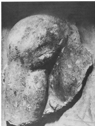
1. Τμήμα γύψινου εκτύπου του ανατολικού συγκροτήματος του ανακτόρου της Κνωσού: ώμος, βραχίονας, (σπασμένος χαμηλά πάνω από τον αγκώνα) και μέρος του θώρακα. Σημεκώστε μεταξύ του βραχίονα και του θώρακα το άκρον ενός δακτύλου.