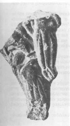
5. Τμήμα χαραγμένου αγγείου που θρέθηκε κοντά στο ανάκτορο της Κνωσού).

Boxing and wrestling are commonly ascribed to the Minoan athletic games. Scholars, however, often confuse these two competitions. Let's examine, for example, the athletic representations of the Boxer rhyton from Agia Triada: twelve boxers are depicted, but no wrestler. Sir A. Evans uncovered (1901) in the eastern side of the Knossos palace several fragments of agonistic high-reliefs. In Palace III (1930) he described one of these as «a part of wrestler relief». However, B. Kaiser gave recently a new interpretation of this specific fragment: the represented athlete is a treading grasping a bull's horn with his left hand. We agree with Kaiser's interpretation and supply new, supporting arguments. Therefore, wrestling cannot anymore be considered undisputedly as an athletic Minoan game and further research is necessary.