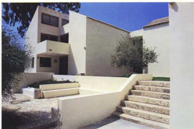
Μουσείο Σάμου. Η νέα πτέρυγα.

Το τμήμα του Γ.Α.Ι. της Αθήνας ιδρύθηκε το 1874. Στεγάζεται στο κέντρο της πόλης σε σπίτι που έκτισαν για τον Ερρ. Σλήμαν οι αρχιτέκτονες Β. Ντέρτρεφελντ και Ερν. Τάιλερ, σε κλασικό ρυθμό. Το Γ.Α.Ι. της Αθήνας έχει πλούσια βιβλιοθήκη πάνω από 60.000 τόμους, με έργα που αφορούν στις ανασκαφικές έρευνες και την ελληνική αρχαιολογία.