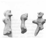
Ολυμπία. Γεωμετρικές τερακοττες

Οι ανασκαφές του Γερμανικού Αρχαιολογικού Ινστιτούτου στην Αρχαία Ολυμπία υπό τη διεύθυνση του Helmut Kyrieleis διεξήχθησαν στην περιοχή του Πελοπίου και στην περιοχή βορείως του Πρυτανείου. Σκοπός των ανασκαφικών ερευνών ήταν η στρωματογραφική έρευνα, κυρίως της προϊστορικής εποχής. Το 1908 και το 1929 ο Wilhelm Dörpfeld είχε χαράξει διάφορες τομές σ' αυτή την περιοχή και είχε εντοπίσει όχι