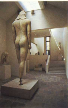
Μουσείο Σάμου. Ο κούρος και άλλα αρχαϊκά γλυπτά στη νέα πτέρυγα.

Οι κυριότερες ανασκαφές του Γ.Α.Ι. στην Ελλάδα είναι οι εξής τέσσερις: