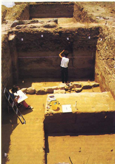
Ολυμπία. Ανασκαφή στο Πελοπίο

Ο καθαρισμός των θεμελίων του μεγάλου θωμού (θωμός του Ροίκου) απεδείχθη χρονοβόρος, απ' ενός λόγω της μεγάλης έκτασης και απ' άλλου λόγω των, εν μέρει, υψηλών επιχώσεων. Μετά το τέλος του καθαρισμού έγινε αποτύπωση και σχε-