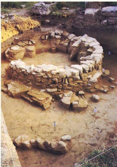
Ολυμπία. Προϊστορικό κτίριο δυτικά του Πελοπιου.