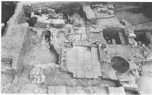
Κεραμικός. Ανασκαφή στο κτίριο «Υ».

έναν μεγάλο πύρινο αγωγό. Αυτός ο αγωγός διασχίζει το «κτίριο Υ» από Β προς Ν και σύμφωνα με τα ευρήματα διατηρήθηκε πάνω από 1000 χρόνια μέχρι την εποχή της ύστερης αρχαιότητας.