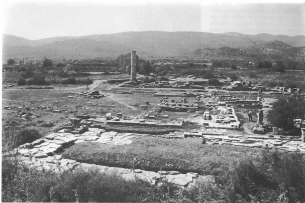
Ηραϊον Σάμου. Ο μεγάλος θυμός μετά τον καθαρισμό.