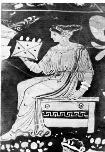
5. ‘Αγγείο τής Κάτω ‘Ιταλίας όπου εικονίζεται μία καρέκλα (κλιστήριο).

By the 6th century BC, the greek furniture was entirely greek in conception and e- xecution. The greek craftsmen employing their imagination and art reached per- fection of form and function. These furni- ture served as a model for the roman, the middle-age and even the european furni- ture.