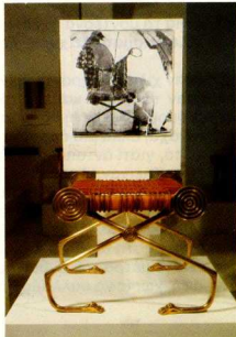
3. Σκαμνί (άντίγραφο).