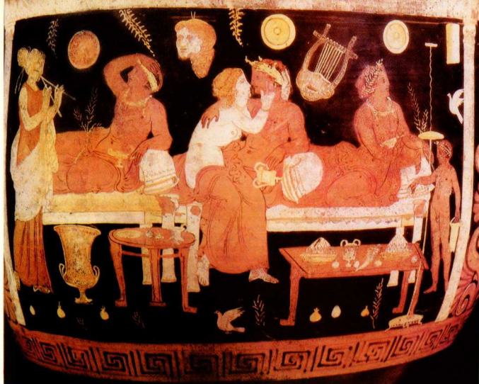
1. Άγγείο της Κάτω Ίταλίας επάνω στο οποίο βλέπουμε δύο κλίνες συμποσίου και δύο τραπέζια με τρία πόδια, τὸ ἓνα ὀρθογώνιο, τὸ ἄλλο στρωγυλῶ.