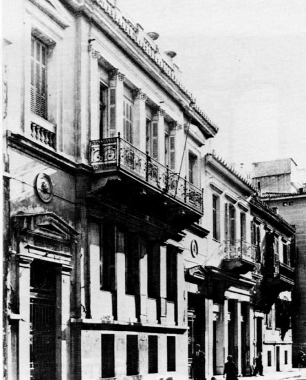
Νεοκλασικά σπίτια τής τελευταίας περιόδου στην οδό Σόλωνος, 'Αθήνα.

'Η 'Ακαδημία καί ή Βιβλιοθήκη είναι επίσης έργα του Th. Hansen, πού εκφράζουν σαφέστερα τήν αλλαγή τών αισθητικών προτιμήσεων τής εποχής μέσα από τήν απαίτηση γιά περισσότερες καί πιό περίτεχνες λεπτομέρειες. Τήν οικοδόμησή τους επέβλεψε ό μαθητής του Γερμανός Ernst Ziller (1837-1923), ό όποιος ήρθε στην 'Ελλάδα τό 1861 καί έμεινε ως τό θάνατό του. 'Εκτίσε πολλά δημόσια κτίρια καί έναν έκπληκτικό μεγάλο άρθμό από μέγαρα, άστικά σπίτια καί επαύλεις. Είναι ό αρχιτέκτονας πού θά δώσει τόν τόνο στην οικοδομική δραστηριότητα τής εποχής. Πέρα από τics αρχαιολογικές απαιτήσεις τής 'Ελληνικής 'Αναβίωσης (Greek Revival), ό Ziller προσπάθησε νά επιδειξει τήν εξοικείωσή του μέ μορφές άλλων εποχών μέσα από ένα όλο καί πιό πλούσιο αρχιτεκτονικό λεξιλόγιο.