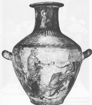
Υδρία από την Κάτω Ιταλία. Στο λευκό φόντο ξεχωρίζουν οι φιγούρες ζωγραφισμένες με τέμπρα (Μουσα, του Λούβρου).

έκφραση και μαλακό δούλεμα του υλικού, ενώ έντονες κινήσεις και συστάσεις του σώματος δίνουν στη τέχνη της Περγάμου. Η κυρίως Ελλάδα κρατά την παράδοση της αλλά συμπληρώνει τα γλυπτικά έργα με στοιχία τοπίου. Τα χαρακτηριστικά αυτά δεν έμειναν ασυτρή τοπικά. Οι καλλιτέχνες ταξίδευαν και κατασκεύαζαν έργα σε όλο τον Ελληνικό, τότε, κόσμο, η επικοινωνία και οι αλληλεπιδράσεις υπηρέξαν έντονες και αμοιβαίες. Το πορτραίτο με τον έντονο ατομικισμό είναι στη βάση της τέχνης των νομισμάτων που γίνονται πια νατουραλιστικές απεικονίσεις των διαφόρων μοναρχών, βασιλέων κ.ά. (βλ. ΑΡΧΑΙΟΛΟΓΙΑ 1 και 2 (1981-2) αντίστοιχα σελ. 31 και 68, Μ. Οικονομίδη, Το νομισματικό πορτραίτο). Αλλά δεν είναι μονάχα το νόμισμα που αποτελεί μεταλλικό έργο τέ-