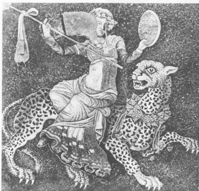
Ο Διόνυσος καθιστός επάνω σε πάνθηρα. Το ψηφιδωτό αυτό είναι από τη Δήλο. Οι έντονες φωτιστικές προσδίδουν όγκο στο έργο. Ο θεός ξεχωρίζει από το ζωώ επάνω στο οποίο καθέται, με ακούρες λουριδές χρωμάτων.