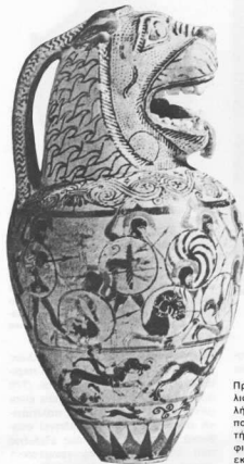
Πρωτοκορινθιακός αρύβαλλος ύψους μόλις 6,8 εκ. Στο πάνω μέρος η λεοντοκεφαλή μαρτυρά για την ανατολίτικη επίδραση που δέχεται η κεραμική της περιόδου αυτής. Στο σώμα του αρυβαλλού είναι ζωγραφισμένοι 10 πολεμιστές σε χώρο ύψους 2 εκ. (Βρετανικό Μουσείο).