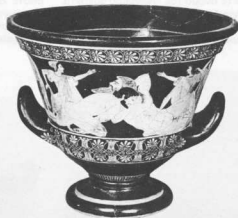
Ερυθρόμορφος αττικός κρατήρας που εικονογραφεί την πάλη του Ηρακλή με τον Ανταίο (Μουσείο Λούβρου).