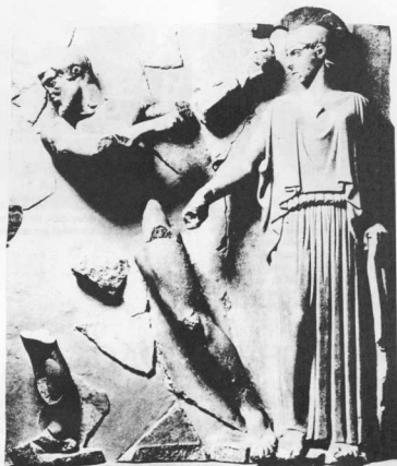
Παράδειγμα μετόπης από το ναό του Διός στην Ολυμπία.

βρέθηκαν τα πρώτα χάλκινα δαιδαλικά αγάλματα (ύψος 40 και 80 εκ.). Στα τέλη του 7ου αιώνα π.Χ. παρατηρείται έντονη αλλαγή στο στυλ της πλαστικής: Τα πέτρινα, άκαμπτα σώματα των αγαλμάτων παίρνουν πνοή, οι κόουροι και οι κόρες φέρουν το ύψος της περιοχής από την οποία προέρχονται, τα σώματά τους έχουν κίνηση (το χέρι και το πόδι απομακρύνονται από τον κορμό). Η επιφάνειά τους είναι χρωματισμένη και σε διάφορες