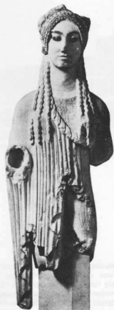
Κόρη της Ακρόπολης (510-500 π.Χ.)