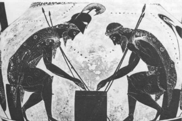
Αττικός αμφορέας του Ερλκιά. Εικονίζει τον Αχιλλέα και τον Αϊαντα. Εντυπωσιακή είναι η ένταση του χρώματος και η εκφραστικότητα των μορφών με τις λεπτομέρειες σημειωμένες με λεπτή χάραξη (Μουσείο Βατικανού).