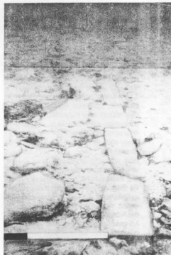
Υποβρύχια φωτογραφία του πλακόστρωτου δρόμου της μυκηναϊκής πόλης στο βυθό της περιοχής Ελαφάντηου