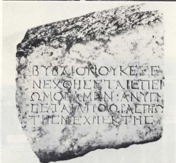
4, 5. Επιγραφές της βιβλιοθήκης του Πανταίου. Η μία από την είσοδο, η άλλη δίνει οδηγίες στους χρήστες της βιβλιοθήκης.

ουγράμματα της βιβλιοθήκης του Πεισιπράτου και να τα ξαναστείλει στην Αθήνα. Στην πόλη της Παλλάδας υπήρξε ονομαστή βιβλιοθήκη και κατά τους χρόνους του Δημητρίου, του Φαληρέα, που έδειξε μεγάλο ενδιαφέρον και ζήλο για τα βιβλία. Ο Πανασίας μνημονεύει την ίδρυση στην Αθήνα βιβλιοθήκης από τον αυτοκράτορα Αδριανό. Στην ίδρυση της βιβλιοθήκης αυτής αναφέρεται και ο Ευσεβίος. Η βιβλιοθήκη του Αδριανού στην Αθήνα ήταν πλούσια, επιβλητική και πολυτελής. Τα ερείπια και το μέγεθος της εντυπωσιάζουν και σήμερα τον επισκέπτη του χώρου της, που βρίσκεται στο τέλος της οδού Φιάλου.