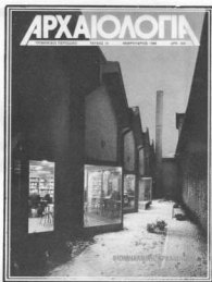
Δημοτική βιβλιοθήκη σε μικρή πόλη της Ιταλίας. Μέσα σε χώρους παλιούς, προορισμένους για βιομηχανική χρήση στήθηκε μια σύγχρονη κατασκευή. Αρχιτέκτονας Cesare Rota Nodari, Ottogono 77, Ιούνιος 1985

και τρόμου και τις νέες μορφές δουλείας που δημιουργούν, εντούτοις συνέβαλαν στην απελευθέρωση του ατόμου από άλλες μορφές εξάρτησης. Ίσως για πρώτη φορά δόθηκε στον άνθρωπο η δυνατότητα σε τέτοια έκταση να ασκεί κριτική στο σύστημα που τον περικλείει. Μια νέα μορφή ανθρωπίνης ευαισθησίας γεννήθηκε με τη βιομηχανική κοινωνία. Στη μελέτη των παραγόντων που τη δημιουργήσαν αποβλέπει η βιομηχανική αρχαιολογία ερευνώντας τα «βιομηχανικά αποτυπώματα», είτε αυτά λέγονται εργοστάσια, είτε μηχανές είτε οποιαδήποτε μορφή πολιτιστικής παραγωγής, και μάλιστα εν τη γενέσει τους, την ιδανικότερη δηλαδή στιγμή για να γίνει κατανοητό ένα φαινόμενο.