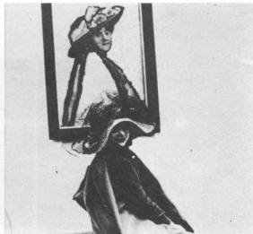
Πρώτο επίπεδο προσέγγισης: Τό μουσείο ως απόλαυση (άπό τήν έκδοση στο Μόναχο).

σμοθετεί τήν πολιτιστική έτερογένεια τής ταξικής κοινωνίας. Έτσι, κληρονόμος τής παγκόσμιας πολιτιστικής παράδοσης θεωρείται