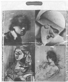
Εκπαιδευτικά προγράμματα του Έκπαιδευτικού Κέντρου Μου-

Η σακούλα θα μπορούσε να ήταν ανώδυνη αν αντί για το ίδιο θέμα σε 4 διαφορετικές αποδόσεις υπήρχαν 4 διαφορετικά μεταξύ τους θέματα. Στην προκειμένη περίπτωση το ιδεολογικό περιεχόμενο έχει ενδιαφέρον. Δείχνει την εγκυρότητα της διαφοράς. Κάθε πολιτισμός, έχει δικό του τρόπο να βλέπει τον κόσμο όπως και κάθε άτομο μέσα στον ίδιο πολιτισμό. Έτσι θεωρούνται οι αισθητικοί κώδικες του ατόμου και κατά πρόκληση οι πολιτισμικοί στόχοι του. Αυτό είναι ανθρωπιστική επίσημη, και μάλιστα ξεκινώντας από μία σακούλα.