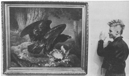
‘Η Διεύρυνση του μουσείου (Museum, τεύχος 144, 1984)

τήν ιδεολογική τους πορεία, ή όποια δέν κάνει τίποτε άλλο από τό τό να επικυρώνει τήν ύπαρξη κάποιου γούστου καί όρισμένη γνώση καί να θε-