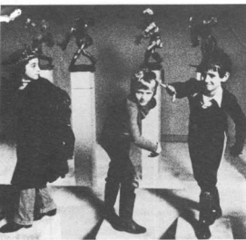
Εκπαιδευτικά προγράμματα του Έκπαιδευτικού Κέντρου Μου-

Σακούλα που χρησιμοποιούν στα μουσεία του Μοναχού για τη συσκευασία των διαφόρων αντικειμένων, -διαφορεκάν, έντυπων, θιβλιάν, που αγοράζει ο επισκέπτης.