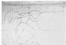
4. Σχέδιο μέρους τῆς μελέτης τῆς γιγαντομαχίας τῆς βόρειας ζωφόρου.

έπίσης γράφει σε καιρία σημεία τά πόδια τών αλόγων.