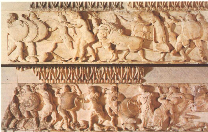
2. Βορεια ζωφορας.