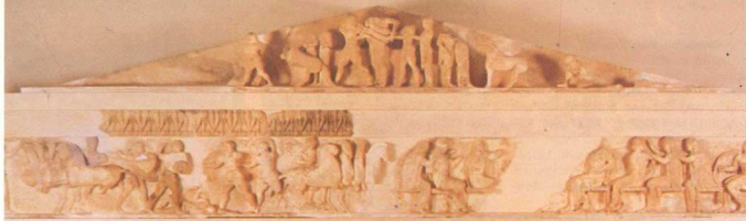
1. Ανατολική ζωφόρος με τό αέτωμα.