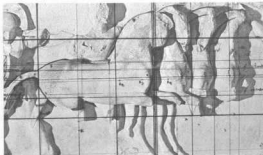
5. Ο κανόνας και οι χαράξεις στα τέσσερα αόλα της ανατολικής ζωφόρου.