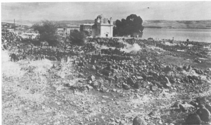
Τό ελληνικό τμήμα της Καπερναούμ, όπως φαίνεται από δυτικά. Στο κέντρο της φωτογραφίας είναι η ελληνική ορθόδοξη εκκλησία.