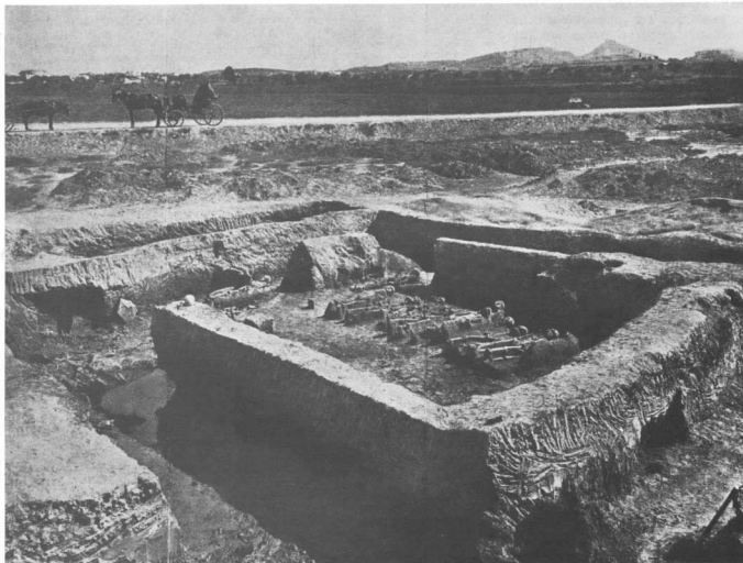
Τα πολυάνδρια του Φαληρικού Δέλτα. Ακριβώς πίσω διακρίνεται η Λεωφόρος Συγγρού και στο βάθος δεξιά ο Λυκαβητός (φωτογραφία από το θρόνο του Α. Κεραμοπούλλου. Ο αποτυμpanισμός, εικ. 12).