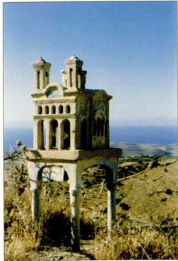
2-3. Ο τύπος του ναόσημου προσκυνηταρίου διαφοροποιείται από τον τύπο του κιβωρίου στην αντιμετώπιση του ως μικρογραφίας συγκεκριμένων νοοδομικών τύπων.