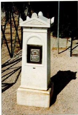
5. Η συνθετική διαπραγμάτευση της σχέσης βάσης-κορμού/σώματος ανέδειξε έναν διακριτό τύπο, τη στήλη-ναϊσκό. Σε αρκετές περιπτώσεις το κιβώριο ενσωματώθηκε στο βάθρο, ώστε όλο το ενιαίο σώμα (βάση-κορμός) να επιστέφεται με δίριχτη, θολωτή ή καμαροσκεπή στέγη.