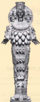
Το άγαλμα της Εφέσιας Αρτέμιδας. Οι πολλοί μαστοί της θεάς δηλώνουν πως είναι θεά της αφθονίας.