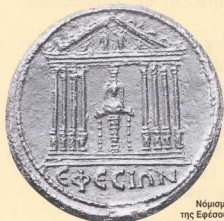
Νόμισμα της Εφέσου, που στη μία του όψη παριστάνει τον περίφημο ναό.