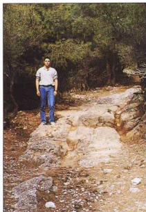
1, 2. Το καθαρισμένο τμήμα του δρόμου.