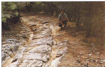
4 (δεξιά). Στήριξη του αρχαίου δρόμου.