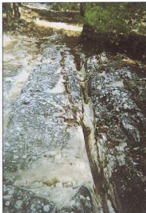
3 (κάτω). Λεπτομέρεια του δρόμου με τις "ροδιάς".