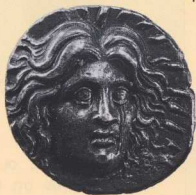
1. Ασπμένιο νόμισμα (τετράδραχμο) της Ρόδου που στη μια του όψη εικονίζει το θεό Ήλιο-Απόλλωνα. Το πορτρέτο δίνει την εικόνα του Κολοσσού.