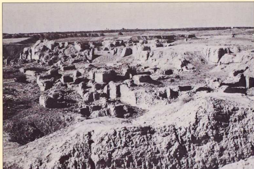
2. Στις μέρες μας μόνο αυτά τα ερείπια μαρτυρούν το μεγαλείο της Βαβυλώνας.