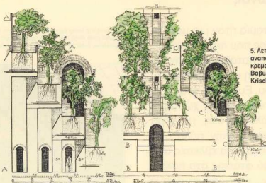
5. Λεπτομέρεια της αναπαράστασης των κρεμαστών κήπων της Βαβυλώνας από τον Fr. Krischen.

φυτέψει όλων των ειδών τα δένδρα, φοινικιές, ροδιές, χουρμαδιές, βερικοκιές, συκιές, λουλούδια και μυριστικούς θάμνους, βασιλικό, κύμινο, και μέντα. Οι Μεσοποταμίοι υδραυλικοί είχαν βρει τρόπους να ανεβάζουν το νερό του Ευφράτη ψηλά για να ποτίζουν αυτούς τους κρεμαστούς κήπους. Μύθος ή πραγματικότητα, δεν έχει σημασία: ο ταξιδιώτης που ερχόταν από την καυτή έρημο ονειρευόταν πρασινάδα, νερό και σκιά!