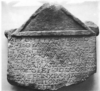
Στήλη με ιερό νόμο από το σπήλαιο του Πανός στο Μαραθώνα, ανάθημα εφήβων 61/60 π.Χ. (Το κείμενο δημοσιεύτηκε στα «Φιλία Ἐπις Γεώργιον Ε. Μυλωνάν», Β', 306, σφμ. 30.)

επιγραφή σκαλισμένη πάνω σε δύο μαρμάρινα μέλη, προερχόμενα από δωρό, που βρέθηκαν τον περασμένο αιώνα εντοιχισμένα στο πηγάδι «κάποιου Ραμπάνη» κοντά στον Σωρό. Το ένα έφερε τη λέξη: ΑΡΤΕΜΙΔΙΟΣ, το άλλο τη λέξη: ΕΙΕΙΘΥΙΩΝ 33 .