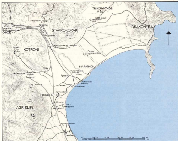
Τοπογραφικός χάρτης του Μαραθώνα (Τραυλάς).

Το ασύλληπτο αποτέλεσμα της μάχης που μοιάζει να εκπορεύθηκε από υπερφυσικές δυνάμεις μετουσιώνει τους συντελεστές του σε Ήρωες. Ως Ήρωες λατρεύθηκαν από τους Έλληνες αυτοί που έπεσαν στη μάχη 1 , στη μνήμη των οποίων «Τάφος δὲ ἐν τῷ πεδίῳ ἀθιναίων ἔστιν, ἐπὶ δὲ αὐτῷ στήλαι τὰ ὄνόματα τῶν ἀποθανόντων κατὰ φυλάς ἐκάστων ἔχουσαι, καὶ ἕτερος πλῆταιεῦσι δοσιῶν καὶ δούλοις» (Παυσ. Ι, 32, 3). Με ιδιαίτερο Μνημείο τιμήθηκε ο Μιλτιάδης 2 . Εξανθρωπισμένοι θεοὶ οδήγησαν στη μάχη τις τάξεις των Αθηναίων και Πλαταιαίων, τη συμβολή των οποίων κατέγραψε ο Πάναϊνος στη γνωστή εικόνα της Ποικιλίας Στοάς της Αγορᾶς των Αθηνῶν 3 : μαζί με τον Μιλτιάδη, τον Καλλίμαχο και τους άλλους, η Αθηνά, ο Παν, ο Ηρακλής, ο Θησέας, ο Μαραθάνας, ο Ξεχάλοιος. Από τις θεότητες που διεκδικήσαν κατ' ἐξοχήν «μερίδιο» για τη συμβολή τους στη μάχη — και το πήραν, σύμφωνα με τις μαρτυρίες και τις ενδείξεις — είναι ο Ηρακλής και ο Παν. Και των δύο