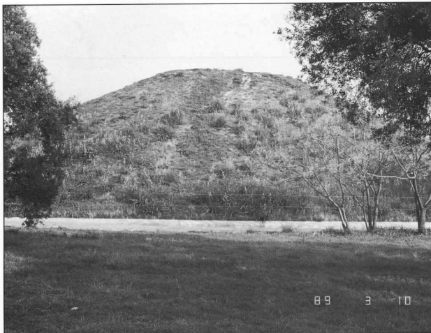
Ο Τύμβος του Μαραθώνα (5ος αι. π.Χ.).