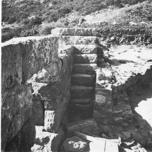
Εσωτερικό της ανατολικής πύλης. Κλίμακα που οδηγεί στον περίπατο του τείχους.

ανήκε στην οικογένεια του Πυθάρχου. Ο ναϊσκος του περιβόλου με το παράξενο, όπως έχει γίνει από τα νερά της βροχής, ανάγλυφό του είναι εύρημα που έγινε μέσα σε αρκετές δεκαετίες, κομμάτι-κομμάτι. Οι νεότερες έρευνες του έδωσαν το αρχικό του σχήμα. Τον μεγάλο ναϊσκο συνόδευε εκτός από τη στήλη του τάφου και μια μικρότερη με ανάγλυφη παράσταση του Πυθάρχου, της αδελφής του Πυθοκρίτης και ενός μικρού αγοριού.