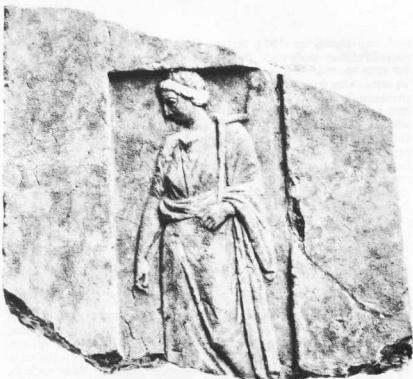
Επίτμβια στήλη ιέρειας με το σύμβολο του λειτουργημάτός της, το κλειδί του ναού. Δεύτερο μισό του 4ου π.Χ. αι.

Η απαγόρευση της ανοικοδόμησης των κατεστραμμένων από τους Πέρσες ιερών και ναών της Αττικής βάστηκε ως το 449 π.Χ. Τότε με πρόταση του Περικλέους αποφασίστηκε να χρησιμοποιηθούν χρήματα της αθηναϊκής συμμαχίας για την κατασκευή ιερών οικοδομημάτων στην Ακρόπολη και από τη χρονιά αυτή ως το τέλος του 5ου αι. κατασκευάζεται στην Αττική σειρά ναών.