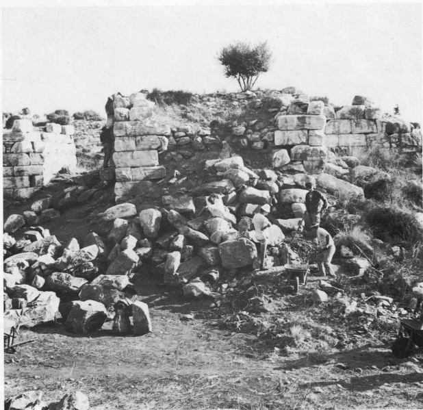
Η νότια πύλη του φρουρίου του Ραμνούντος.

Στον βόρειο δρόμο υπήρχαν και άλλοι σημαντικοί περίβολοι, ο μικρός της Μνησικρατείας και του Λυσιόπου με την ωραία αετωματική στήλη, που χρησιμοποιήθηκε για πρώτη φορά τον 4ο αιώνα π.Χ. και για δεύτερη και τελευταία τον 2ο αιώνα, για τον διογγονο του Λυσιόπου Λυσικλειδή. Απέναντι σχεδόν, στην αριστερή πλευρά του δρόμου, άλλος μεγάλος περίβολος