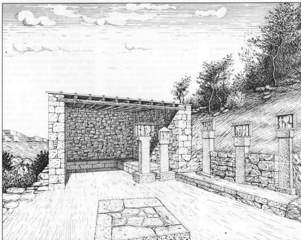
Το Αμφιθέατρο του Ραμνούντος. Αναπαράσταση (σχ. Κ. Ηλιάκη).

Πριν αφήσουμε το κάτω φρούριο, που είναι σχεδόν ανεξερεύνητο, θα σταθούμε σ' ένα μικρό