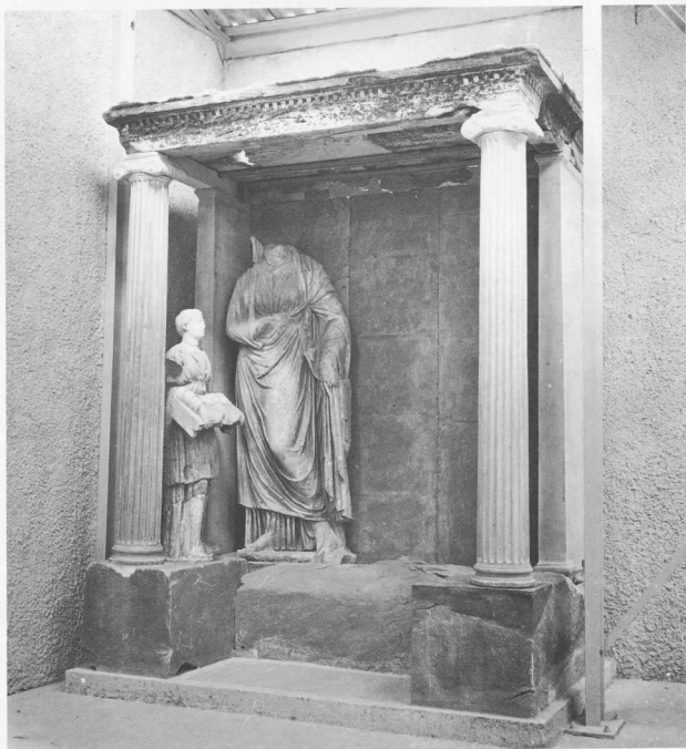
Ο αναστηλωμένος επιτύμβιος ναίκος του περιδόλου του Διογεΐτονος. Δεύτερο μισό του 4ου π.Χ. αι.

μείφθηκε. Το κύριο μόνο μέρος της θάσης αποτελείται σήμερα από 293 κομμάτια, και από αυτά 128 είναι γλυπτών, από τα οποία μόνο 30 κολλούν στη θάση. Μας λείπουν λοιπόν πολλά ακόμη και τούτο σημαίνει πως οι έρευνες πρέπει να συνεχιστούν. Πού όμως, αυτό είναι το πρόβλημα. Ο Ραμούντος δεν αποκαλύπτει τα μυστικά του εύκολα. Χιλιάδες χρόνια τον λεηλατούσαν, κατέ-