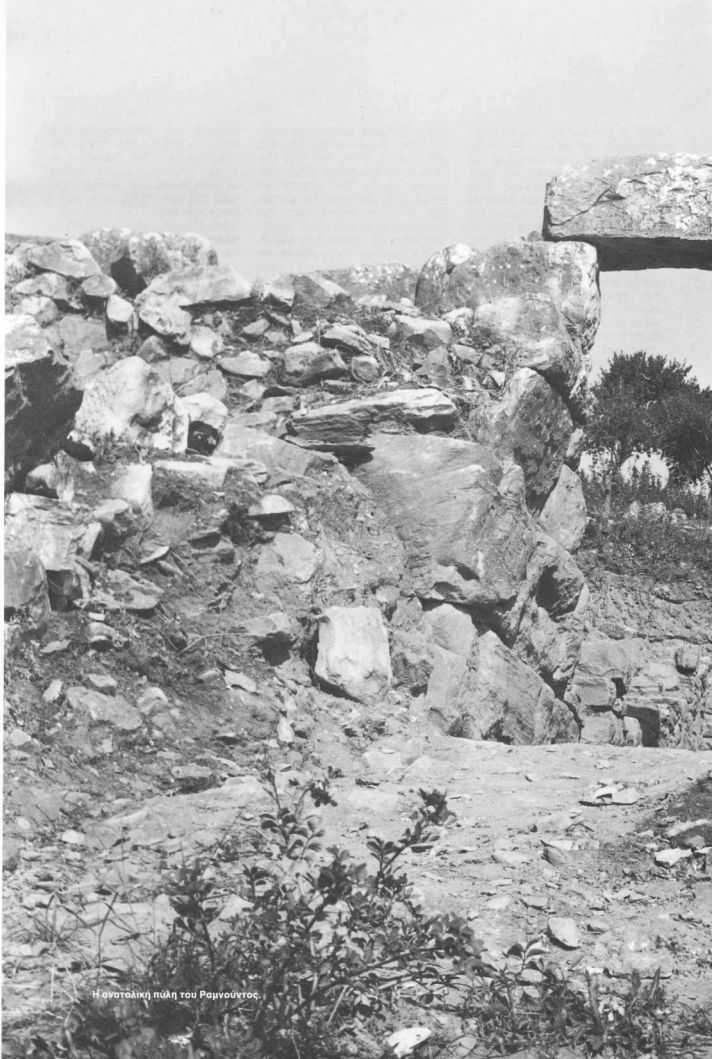
Η ανατολική πύλη του Ραμνούτιος.