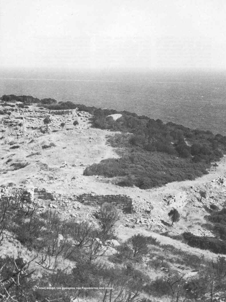
Γενική άποψη του φρουρίου του Ραμνούλιοντος από νότου.